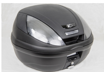
TOP CASE KYMCO NOIR 39L KA-01-0438