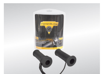
POIGNEES CHAUFFANTES KA-01-0444