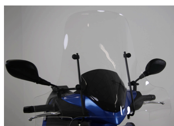
PARE BRISE HAUT KA-01-0132