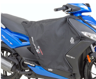
TABLIER DOUBLE 8 KA-01-0369